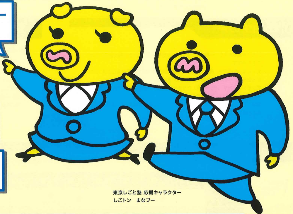
東京しごと塾 応援キャラクター しごトン まなブー