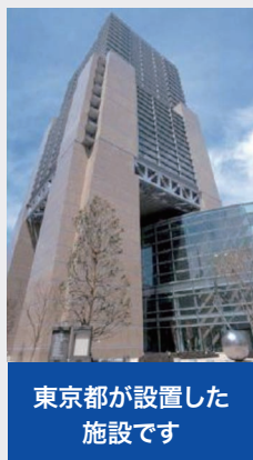
東京都が設置した 施設です